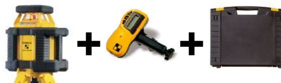
LAR 200 Set